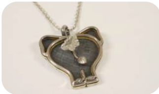
Erendira Contis “Dónde quedó mi mariposa”