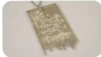
Ismael Rosales Rivera "Orgullosa"