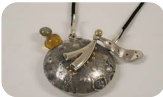
Lewis Kant “Lo esencial es invisible a los ojos”