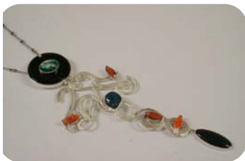
Gisella de Chavez “El pueblo de mi Abuelo”