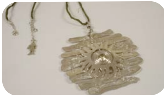
Isela Robles "Sol y Viento "