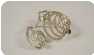
Isela Rosas “Alcanzame si puedes”