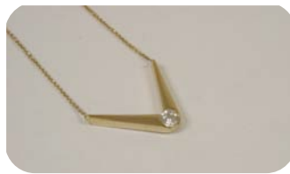
Ismael Rosales Rivera “Ave Fénix”