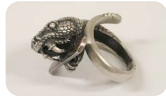
Erendira Contis “No temo a los tuyos, sino a los del tiempo”